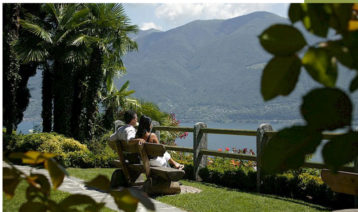
Parkhotel Brenscino – laddove è difficile partire