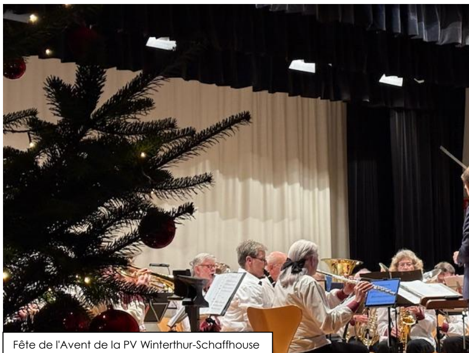
Fête de l'Avent de la PV Winterthur-Schaffhouse

Chaque année, environ 450 actifs et actives rejoignent la PV à la fin de leur vie professionnelle. Mais les démissions se multiplient à ce stade. Il est désormais courant de considérer que le syndicat n'est utile qu'aux actifs et de démissionner à l'approche de la retraite. Il est cependant incontestable qu'un syndicat est également important pour les retraité-e-s. Sans le SEV et la PV, nous aurions par exemple perdu les FVP ou n'aurions pas obtenu d'allocation de renchérissement de la CP CFF. Nous nous engageons à convaincre ces collègues de rejoindre le PV et à les garder au SEV.