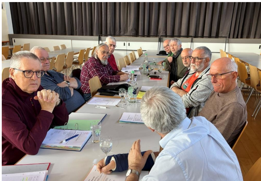
Séance du CC-PV à Grolley avec les présidents de Suisse romande

Le comité central s'est réuni à huit reprises, dont une fois via Zoom, afin de discuter des affaires en cours.